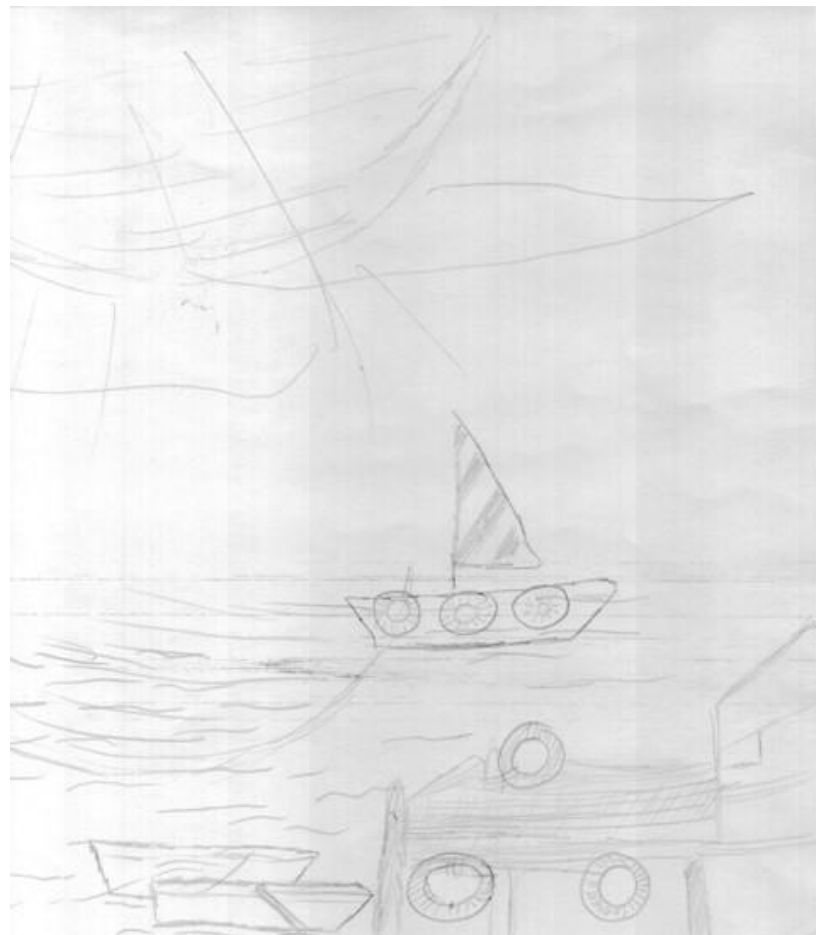
Desen realizat de: Gică Vasile, 14 ani