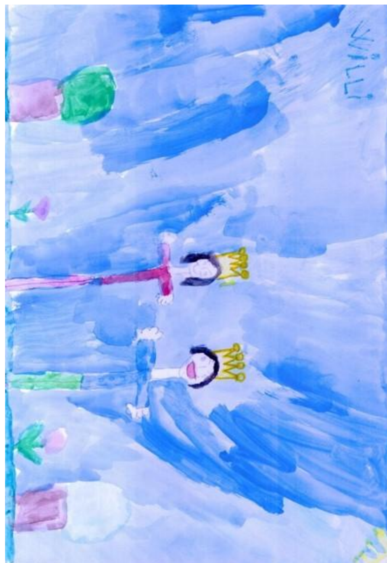
Pictură realizată de: Willi Bolivera, 6ani